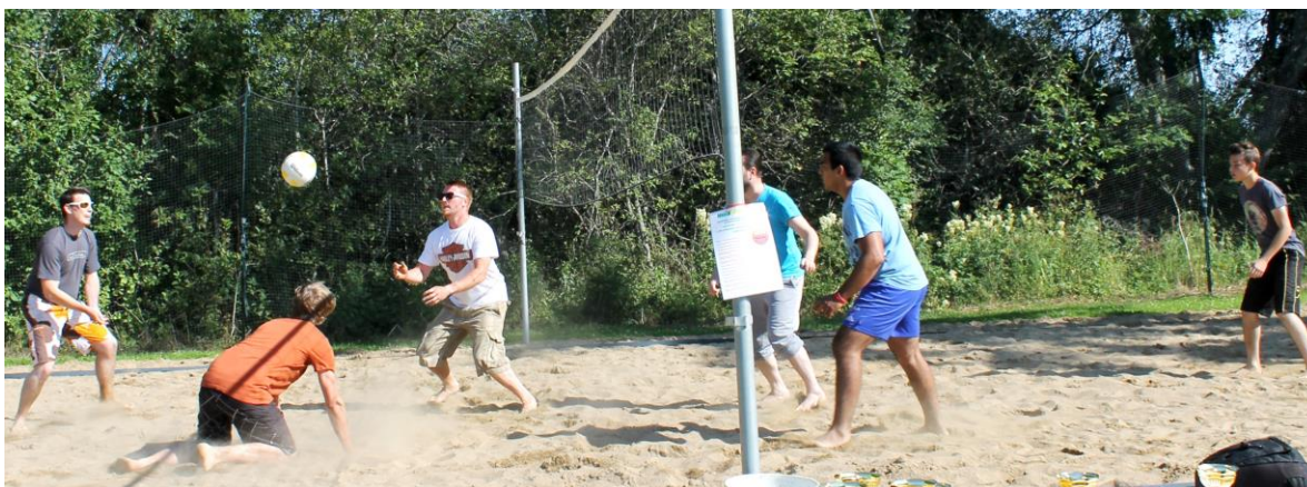
(vastakkain pelaavat KKT ja Lilsey, ottelun voitti KKT 21 - 13)

Joukkueet alkoivat valua Vartiolan urheilukeskuksen rantalentopallokentälle iltapäivällä kello kolmen jälkeen. Yksi toisensa jälkeen joukkueet ilmoittautuivat mukaan turnaukseen ja nimesivät ryhmänsä mielikuvituksella koristelluin nimin. Juuri ennen neljää kun turnauksen oli määrä alkaa, kasassa oli 10 kolmen tai neljän hengen joukkuetta, jotka odottivat vuoroaan malttamattomina päästä pelaamaan Vartiolan hiekalle. Mukana olivat Kuku Team, Tepsi, KKT, Lilsey, Team Venla, Valo, CR7, Papa Sierra, Beautiful Boys ja Team Best. Ilmoittautuneet joukkueet jaettiin kahteen viiden joukkueen lohkoon, jonka myötä jokaiselle joukkueelle tuli neljä alkusarjan peliä pelattavaksi. Alkusarjan jälkeen kummankin lohkon kaksi parhaiten sijoittunutta joukkuetta ylsivät välierään, josta vielä voittajajoukkueet finaaliin, jossa ratkaistiin HeinäBiitsiTurnauksen kiistaton mestari. Näin pelejä syntyi pelattavaksi päivän mittaan yhteensä 23 kappaletta turnauksessa. Yksi yksittäinen peli sovittiin yhdessä pelattavaksi 21 pisteeseen. Ja ennen turnauksen alkua kävimme vielä kaikkien joukkueiden kanssa turnauksen säännöt ja ohjeet läpi niin suomeksi kuin osallistujien pyynnöstä myös englanniksi sillä puolet turnauksen osallistujajoukkueista saapui paikalle SPR:n vastaanottokeskuksesta ja kaikilla heidän asiakkailaan ei vielä ole täysin suomen kieli hallussa. Päivän mittaan tuomarointi vaati myös kansainvälisyyttä, milloin espanjaksi, suomeksi, englanniksi ja saksaksikin.