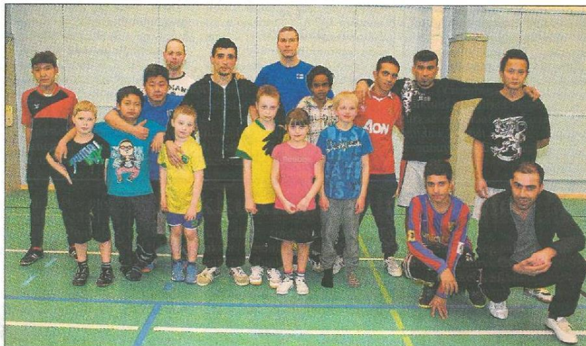
Futsal-turnauksen voittanut FC Dream Team ja Fair play-palkinnon saanut Ykkönen yhteisportetissa.

Pelien välissä pelaajat ja katsojat pääsivät maistelemaan K-Supermarket Pourun lahjoittamia omenoita sekä Trion lahjoittamia pitsoja. Yhteistyökuviassa oli mukana myös Laitumen Pallo ry.