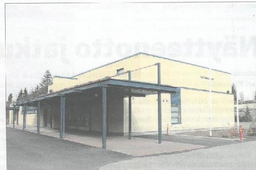
Punkalaitumen liikuntahalli saneerattiin lähes kokonaisuudessaan. Remontti maksoi reilun miljoonan, josta valtion tuki oli yli 300 000 euroa.