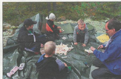
Partioliippukunta Metsänkävijöiden pisteellä pääsi tekemään taskunuotion. Puukapuloista paperinarulla koottu taskunuotio menee kasaan ja on helppo kuljettua mukana metsäretkelle. Taskunuotiolla saa mukavasti keitettyä kahvit.