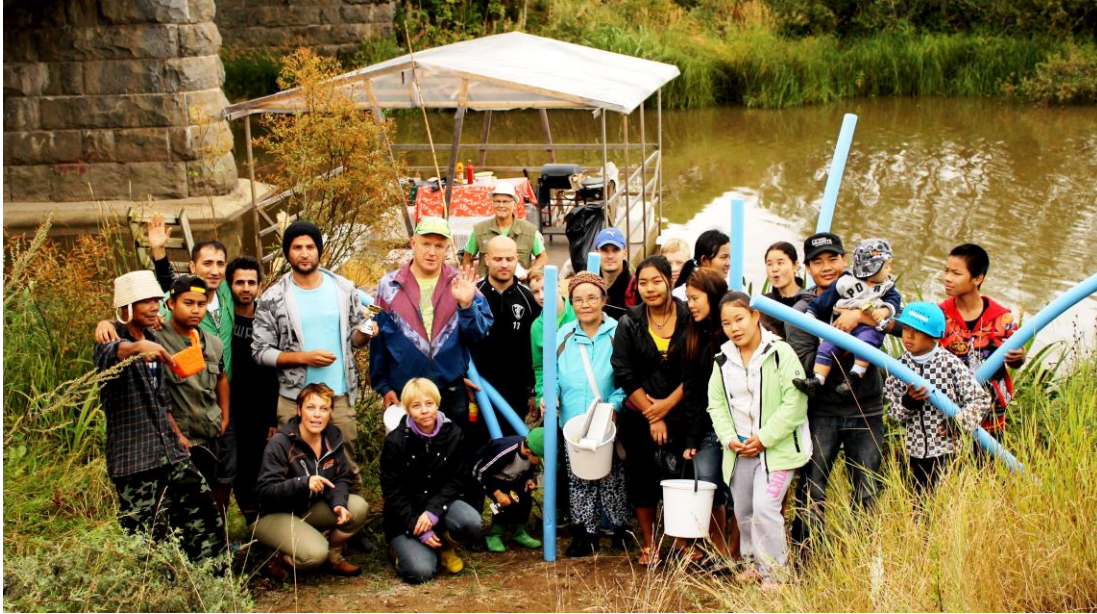
(palkintojenjaon jälkeen vielä yhteiskuva osasta onkikipailuun osallistuneista henkilöistä)

Punkalaitumelaisten maahanmuuttajahankkeiden ja yhteistyössä paikallisten yhdistysten ja yritysten kanssa kehittämästä rennosta onkipäivästä on syntynyt jo perinne Punkalaitumelle. Perinne, joka kerää joenvarteen leikkimielisesti ja rennosti kisailemaan onginnan avulla paikallisia pikkulapsia, nuoria, aikuisia, vanhuksia, maahanmuuttajia, yhdistysten edustajia ja satunnaisia matkajia kuin perinteisiä kesäasukkaitakin.