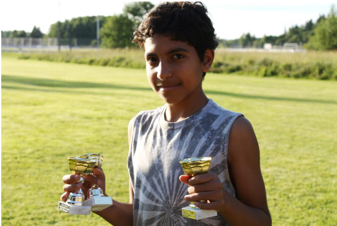
(tyytyväisenä Fair Play- pystit kourassa)

Pelejä pelattiin ja viimeisteltiin liukuhihnalta kunnes välierien jälkeen pidimme pienen viisi minuuttisen hengähdystauon ennen pelillisesti uskomattoman hyvätasoista ja rehtihenkistä finaalia, jossa Tepsi voitti lopulta KKT:n 21-12. Finaalin jälkeen palkittiin ensin turnauksen nelihenkinen Fair Play- joukkue; Beautiful Boys, joka koostui SPR:n vastaanottokeskuksen lapsista. Osa nuorista väsähti jo ennen pitkän turnauksen loppua ja he lähtivät takaisin keskuksen viimeisen pelinsä pelattuaan, mutta yksi ja vanhin joukkueen lapsista jaksoi jäädä turnauksen loppuun ja vastaanottaa joukkueen palkinnot.