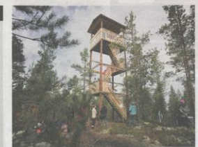
Puinen maisematorni istuu hyvin Porttikallion laelta.

Sijaitsee Porttikallion ulkoikuntakeskuksessa Punkalaitumella. Puurakenteinen torni on 13 metriä korkea ja sen ylläsaateella saa olla kerrallaan 20 ihmistä. Tornin rakentaminen maksoi noin 4 000 euroa.