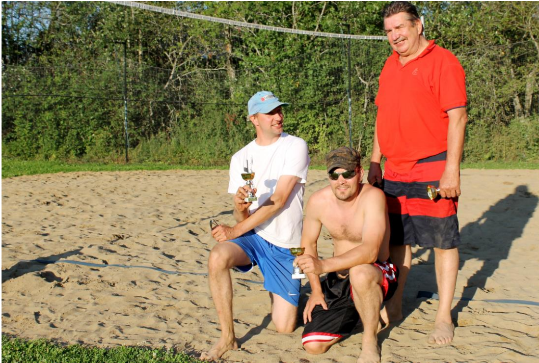
(turnauksen voittanut joukkue Tepsi finaalin jälkeen)

Idea HeinäBiitsiTurnauksesta lähti liikkeelle Monikulttuurisesti liikkuen -hankkeen ohjausryhmän palaverissa torstaina 20.6. ja se syntyi toteutettavaan muotoon sitä seuranneina viikkoina. Turnaus päätettiin järjestää nimenomaan Punkalaitumen Heinäpäivien yhteydessä, kun muutakin toimintaa järjestettiin kylillä kaikille kuntalaisille sekä lomalaisille. Markkinointi tapahtumasta tapahtui A3 ja A4 kokoisia mainoksia kylille eri toimipisteisiin levittämällä, kunnan omilla Facebook- sivuilla, lehtimainoksena Punkalaitumen sanomissa niin Heinäpäivien tapahtumakalenterin yhteydessä kuin omallakin pienellä mainoksella, tapahtuma kirjattiin myös kunnan tapahtumakalenteriin nettiin, josta lehtimainoksen ja julisteiden ulottumattomissa ovat sen myös saattoivat löytää. Lisäksi kävin SPR:n vastaanottokeskuksessa kahteen otteeseen turnausta edeltävinä viikkoina pitämässä kaikille avoimet rantalentopalloharjoitukset, joihin osallistui reilusti innokkaita pelaajia. Kumpaistenkin harjoitusten yhteydessä mainitsin myös tulevasta turnauksesta ja motivoin ihmisiä tulemaan paikalle viihtymään ja pelaamaan. Turnausperjantaita edeltävän torstain harjoitusten jälkeen motivoin myös vastaanottokeskuksen ohjaajia mukaan turnaukseen niin pelaamaan kuin kuljettamaan heidän asiakkaitaan autoilla Vartiolan kentälle.